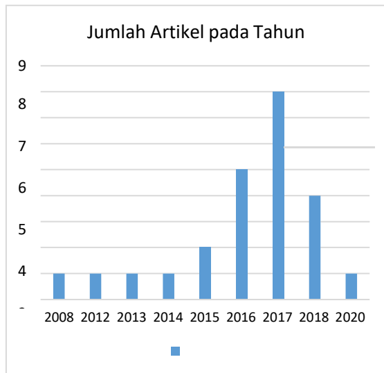
Gambar 1. Kecenderungan Publikasi Artikel dengan Topik Pendekatan JAS

publikasi artikel dengan topik pendekatan JAS pembelajaran biologi hanya satu artikel saja dibandingkan dengan tahun 2015, 2016, 2017 dan 2018 dipublikasikan lebih dari satu artikel pada portal digital.