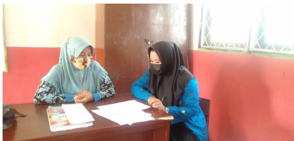
Gambar 4. Foto Observasi dengan dengan Guru Wali kelas V A