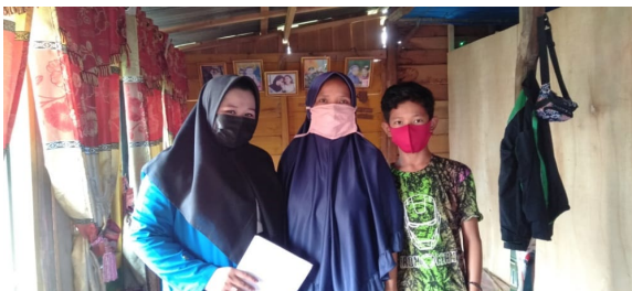
Gambar 3. Foto Wawancara dengan Orangtua Siswa V A