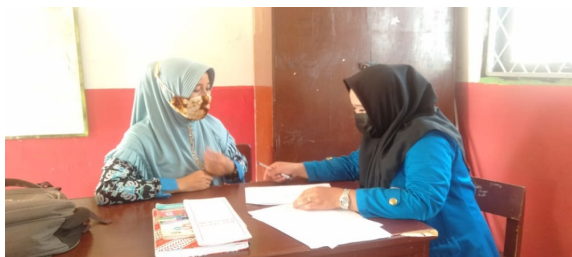
Gambar 2. Foto Wawancara dengan Guru Wali kelas V A