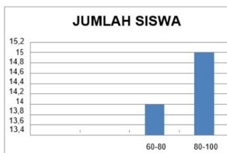
► Gambar 4.4 Diagram Jumlah Siswa

Pada pertemuan kedua siklus II ini sudah sangat-sangat baik. Hasil belajar siswa dalam membaca teknik scanning ini bisa dilihat dalam lampiran X.