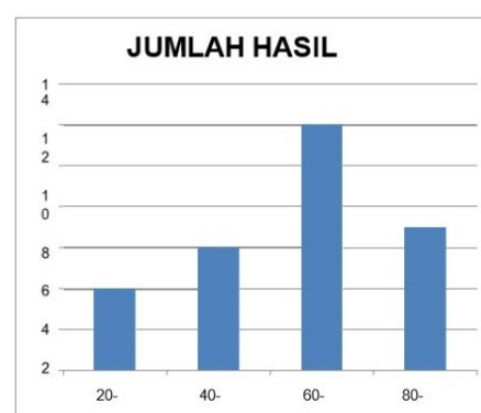
Gambar 4.2 Diagram Jumlah Siswa

Hasil belajar siswa pada pertemuan kedua ini siswa sangat antusias dalam membaca cepat dan sudah banyak siswa yang mampu melumpuhkan kemalasannya dalam membaca, hasil membaca siswa juga sudah meningkat. Hal ini guru atau peneliti memastikan bahwa dalam membaca dalam teknik scanning siswa dalam pertemuan kedua ini sudah mulai membaik.