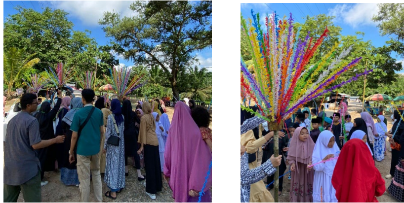
Gambar 2. Pawai Pembukaan MTQ Desa Merangin

Acara pertama yang dilakukan setelah pembukaan adalah melakukan pawai bersama para peserta MTQ dengan rute perjalanan dari lintas jalan raya merangin dengan berjarak sekitar 300 meter menuju ke Masjid Baiturrahman. Dengan memperkenalkan anak-anak (peserta) sesuai dengan dusun tempat tinggal mereka, yang mana kegiatan pawai ini membuat para peserta sangat antusias menjalankannya karna ini kali pertama mereka melakukan pawai pembukaan MTQ didesa mereka.