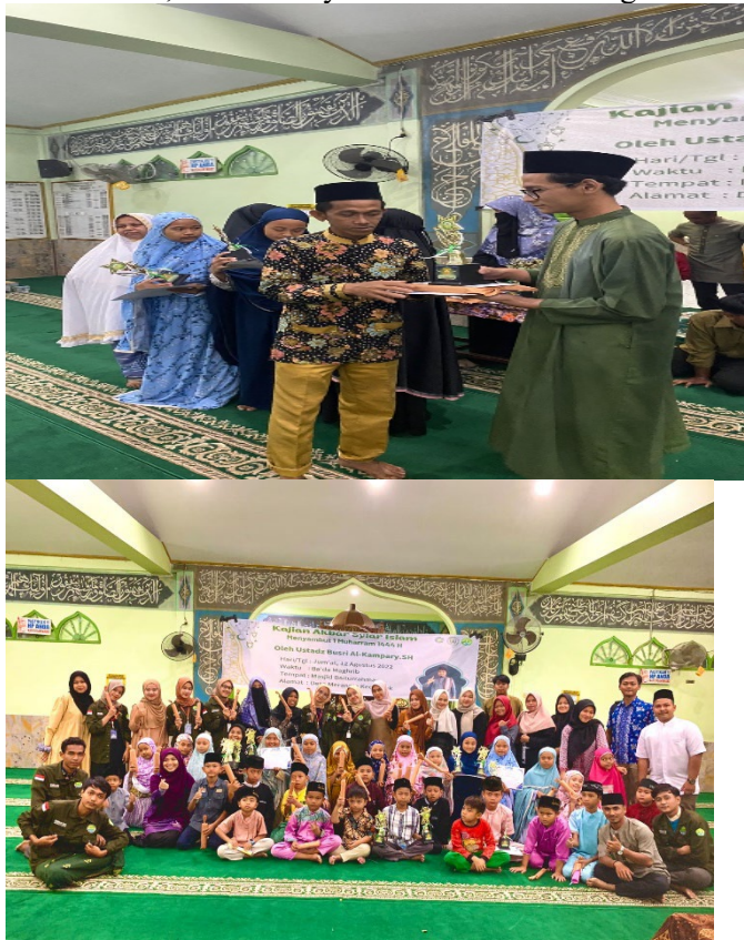
Gambar 4. Pembagian hadiah kepada para peserta yang memenangkan lomba oleh kepala PDTA Baiturrahman dan foto bersama antara peserta lomba, mahasiswa Kukerta, dan Pemuka Masyarakat

Berakhirnya kegiatan perlombaan MTQ yang dilaksanakan oleh mahasiswa KUKERTA Universitas Riau, ditandai dengan acara penutupan dan pembagian hadiah kepada peserta yang meraih juara dalam perlombaan MTQ, acara ini bersamaan dengan acara perpisahan dengan mahasiswa KUKERTA Universitas Riau yang telah selesai mengabdikan dirinya kepada Masyarakat Desa Merangin. Harapan kedepannya, dengan hadirnya inovasi yang dilakukan mahasiswa KUKERTA Balek Kampung Universitas Riau, dapat melakukan perubahan kearah yang lebih maju lagi terutama dibidang keagamaan yang diharapkan dengan adanya pelaksanaan MTQ yang telah dilakukan mendorong anak-anak/remaja Desa Merangin yang sebelumnya lantunan suara Azan, karena hanya dilakukan oleh orang dewasa dan bahkan yang sudah tua-tua.