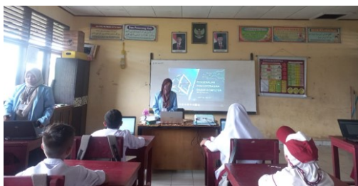
Gambar 2. Pengenalan dan pelatihan computer dasar

Setelah peserta mengerjakan tugas yang diberikan maka peserta dilatih untuk menyimpan dokumen melalui proses penyimpanan di Microsoft Word. Kemudian dilakukan proses buka dokumen kembali.