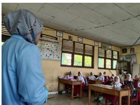
Gambar 3. KKN Mengajar

Adapun maksud dari kegiatan ini adalah untuk mengembangkan potensi Tim Kukerta dalam berinteraksi dan dapat bekerja sama dengan pihak sekolah yang diantaranya dengan guru, peserta didik, dan perangkat sekolah lainnya. Adapun faktor pendukung kegiatan ini yaitu, antusias yang baik oleh para siswa serta dukungan penuh dari wali kelas untuk dilaksanakannya program ini. Sekolah sangat menantikan kehadiran mahasiswa Kukerta untuk menjalankan program di sekolah. Selain faktor pendukung, ada pula faktor penghambat dalam pelaksanaan kegiatan KKN Mengajar yaitu peralatan atau media pembelajaran yang kurang memadai untuk kegiatan mengajar. Meskipun demikian, kegiatan mengajar ini telah terlaksana dengan baik, dan ternyata dengan menjadi pendidik merupakan sebuah pengalaman yang tak ternilai harganya. Di sini, Tim Kukerta juga bisa menambah ilmu, wawasan serta pengalaman menjadi seorang guru atau pendidik.