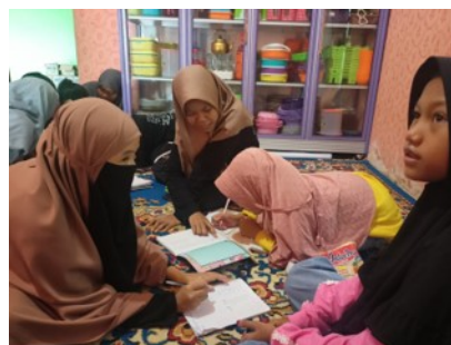
Gambar 4. Kelompok belajar

Materi yang diajarkan disesuaikan dengan materi yang diberikan oleh guru di sekolah, seperti operasi penjumlahan, pengurangan, perkalian, dan pembagian. Materi pelajaran bahasa Inggris juga dalam menambah dan memperluas kosakata mereka, serta membantu mengerjakan PR yang diberikan dari sekolah. Kegiatan ini sangat membantu siswa untuk memahami materi-materi yang belum mereka pahami di sekolah sekaligus membantu siswa menambah pengetahuan mereka atas materi-materi yang tidak mereka dapatkan di sekolah.