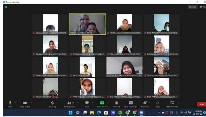
Gambar 1. Pembelajaran Online

Para peserta juga diberikan kesempatan untuk berlatih secara langsung dengan mengikuti tes TOEFL simulasi yang disesuaikan dengan format tes TOEFL yang sebenarnya. Hal ini memungkinkan para peserta untuk memahami dengan lebih baik jenis pertanyaan dan format tes TOEFL, sehingga mereka dapat lebih siap dan percaya diri saat menghadapi tes TOEFL sebenarnya.