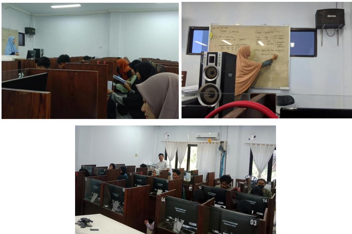
Gambar 3. Belajar Offline oleh Fasilitator

Dalam program ini, peserta juga dibimbing oleh fasilitator yang berpengalaman dalam mengajar bahasa Inggris dan memiliki sertifikasi TOEFL yang diakui internasional. Fasilitator ini membantu peserta dalam memahami materi yang disampaikan, memberikan umpan balik, serta memberikan saran dan tips untuk mempersiapkan diri menghadapi tes TOEFL.